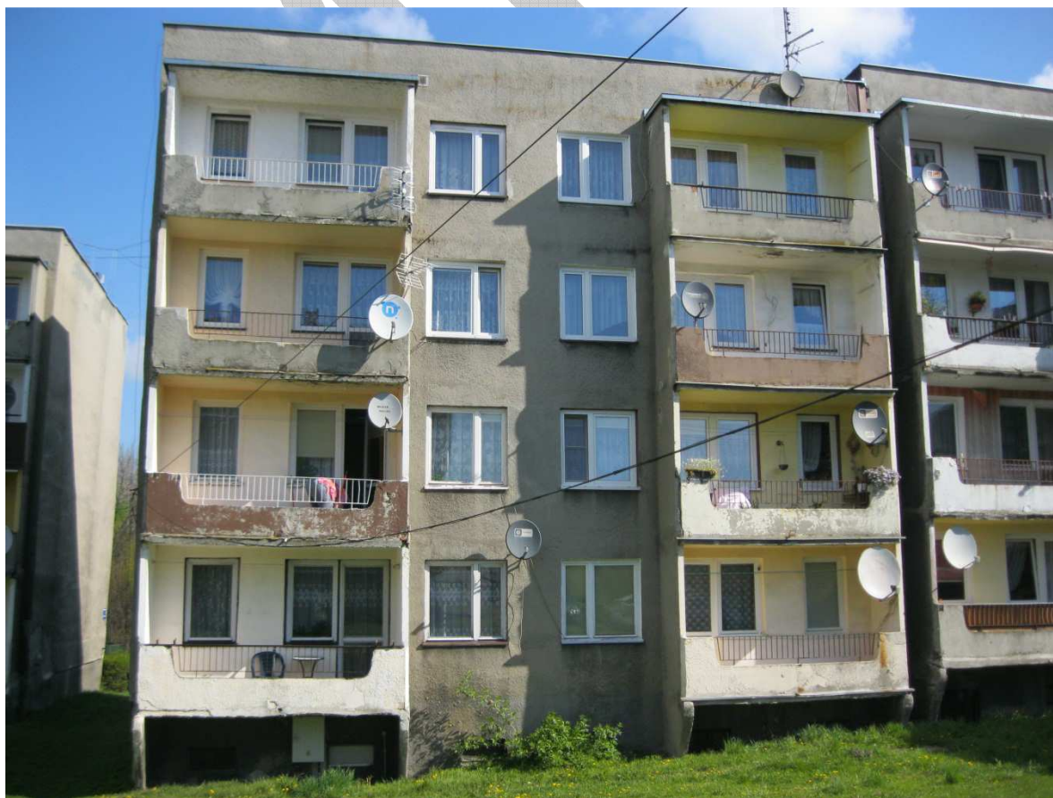
Projekt pionowej ... – ul. Roździeńskiego 13 Piekary Śląskie Wszelkie Prawa Zastrzeżone. Rozwiązania chronione patentami.