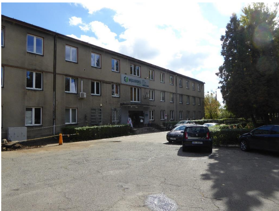
2. Budynek administracyjny – cechownia (nr inw. 105-108123)