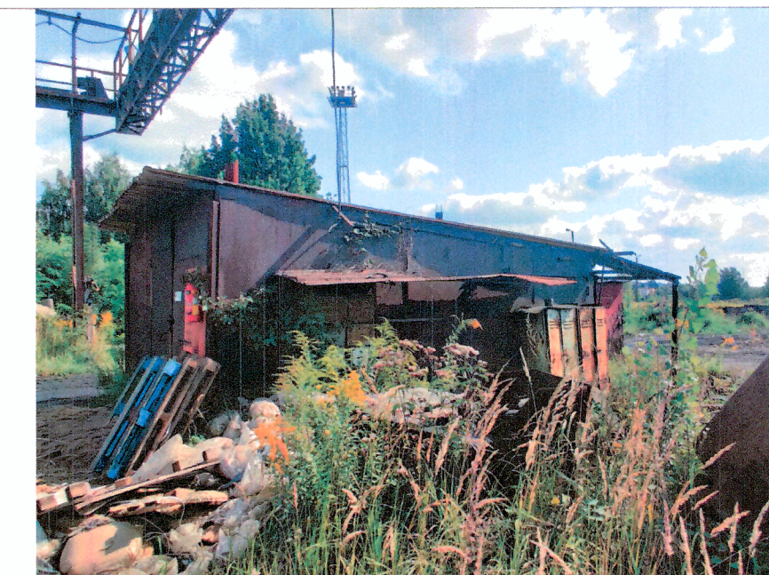
Magazyn prowizoryczny na oleje i smary, budynek garaży samochodowych, garaże samochodowe, budynek zajezdni lokomotyw