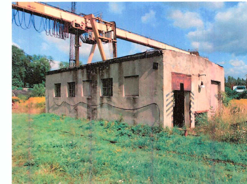
Budynek ołowni drewna