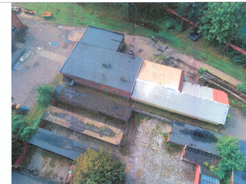
Magazyn prowizoryczny na oleje i smary, budynek garaży samochodowych, garaże samochodowe, budynek zajezdni lokomotyw