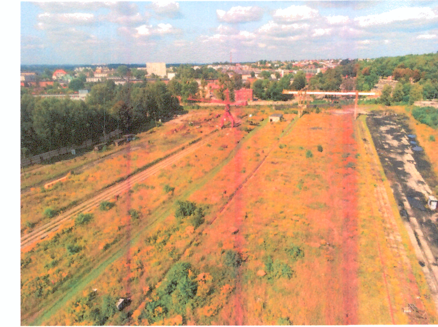
Widok ogólny placu drzewnego